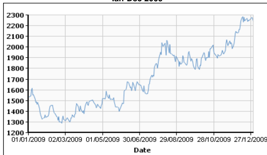
Evoluția prețului aluminiului la Bursa din Londra Ian-Dec 2009

Prețul profilelor din aluminiu este puternic influențat de prețul aluminiului pe piața internațională, mai precis la Bursa de Metale din Londra (London Metal Exchange). În prima parte a anului 2009 prețul aluminiului a avut o evoluție relativ stabilă, oscilând între 1300 și 1600 dolari/tonă. Situația s-a schimbat în a doua jumătate a anului, cotația aluminiului intrând pe o pantă ascendentă, în corelație cu trendul general pe piața internațională a materiilor prime, prețul depășind în luna decembrie 2.200 dolari/tonă.